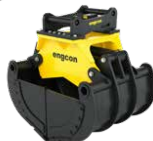
Med täta sidor (tillbehör)