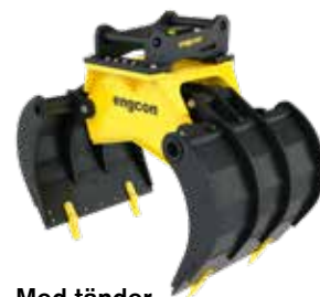
Med tänder (tillbehör)