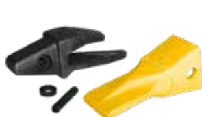
Tandsats typ Cat

Tandsats finns som tillval och levereras då färdigmonterat.